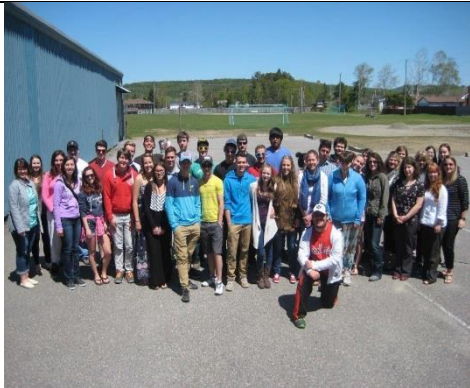
Le groupe du Glad-grad à Wawa

Le CVF prend sa place en tant qu'agence francophone au sein des dîners francophones communautaires à tous les mois. Le CVF a également participé à certains projets menés par des agences communautaires tels la création d'une capsule santé sur le harcèlement sexuel pour Réseau du mieux-être francophone du Nord de l'Ontario (RMEFNO) au projet post-secondaire 101, mené par le Centre de Santé communautaire du Grand Sudbury. Aussi, nous participons à des rassemblements communautaires tels que GladGrad à Wawa ainsi que Reprenons la nuit dans chaque région par exemple.