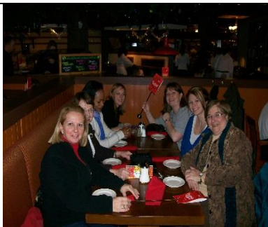
Formation intervenantes Fem'aide - Ottawa

Le personnel du CVF participe régulièrement à des formations durant l'année. Parfois, il s'agit d'une formation pour tout le personnel mais plus souvent qu'autrement, le personnel qui peut se libérer profite des nombreuses opportunités organisées par notre regroupement provincial à l'occasion, par le CVF à d'autres moments et aussi par le biais d'autres agences de nos communautés.